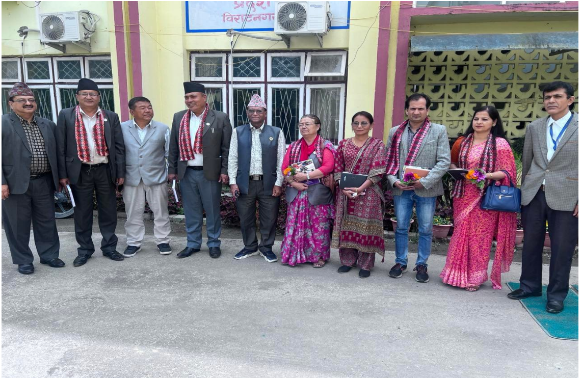
अन्तर प्रदेश अनुभव आदान प्रदान कार्यक्रम, प्रदेश नं. १