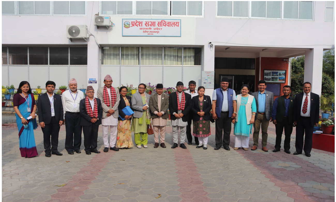
महालेखापरीक्षकज्यूसँगको अन्तर्क्रिया कार्यक्रम