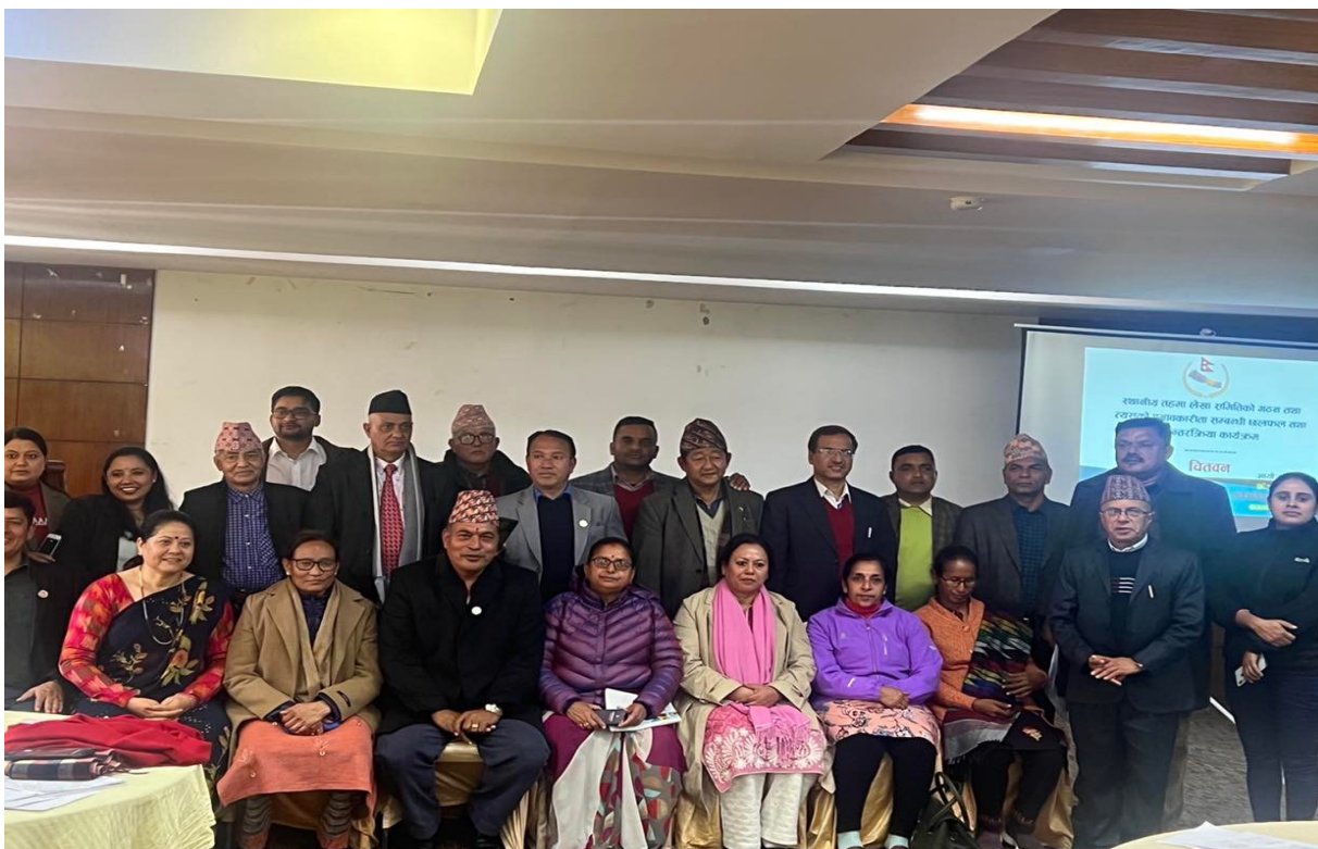
चितवनमा भएको अन्तर्क्रिया कार्यक्रम