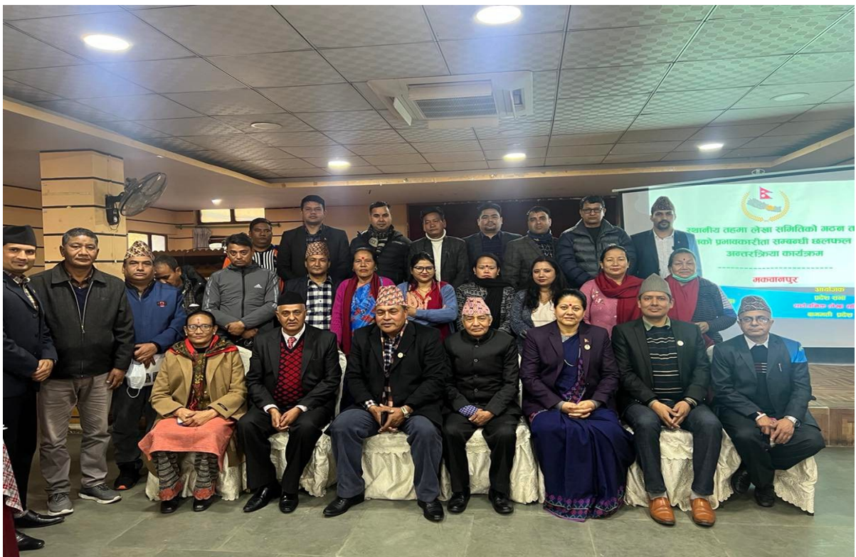
हेटौडामा भएको अन्तर्क्रिया कार्यक्रम